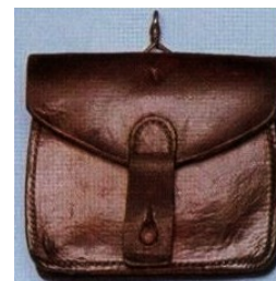
modèle 1888 en cuir noir.