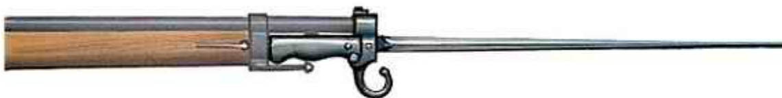
épée-baïonnette de fusil Lebel (1886-1893)

Sa forme "ergonomique" est prévue pour que le combattant fasse un quart de tour vers la gauche avec son fusil avant de ressortir la baïonnette du corps de son ennemi. Ceci est censé provoquer une hémorragie interne qui ne laisse aucune chance de survie à l'ennemi. Il faut dire que la doctrine de guerre française en 1914 était : "seul le mouvement en avant porté jusqu'au corps à corps est décisif et irrésistible".