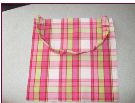
fig. A fig. B fig. C

Couper 2 carrés de tissu de 25 cm de côté (1 cm de couture inclus). Epingler le lien pour le cou sur le bord d'un des carrés sur l'endroit (extrémité sur extrémité). Placer les deux carrés endroit contre endroit (le lien se trouve à l'intérieur) et fixer aux épingles. Coudre au point overlock ou à la surjeteuse sur 3 côtés puis retourner les pièces sur l'endroit.