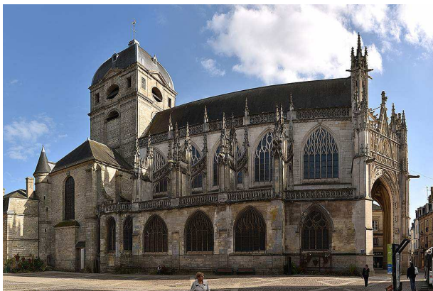
Basilique Notre-Dame d'Alençon