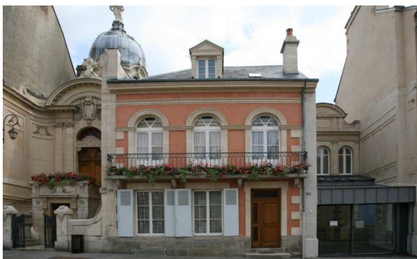
Maison natale de Ste Thérèse de l'enfant Jésus