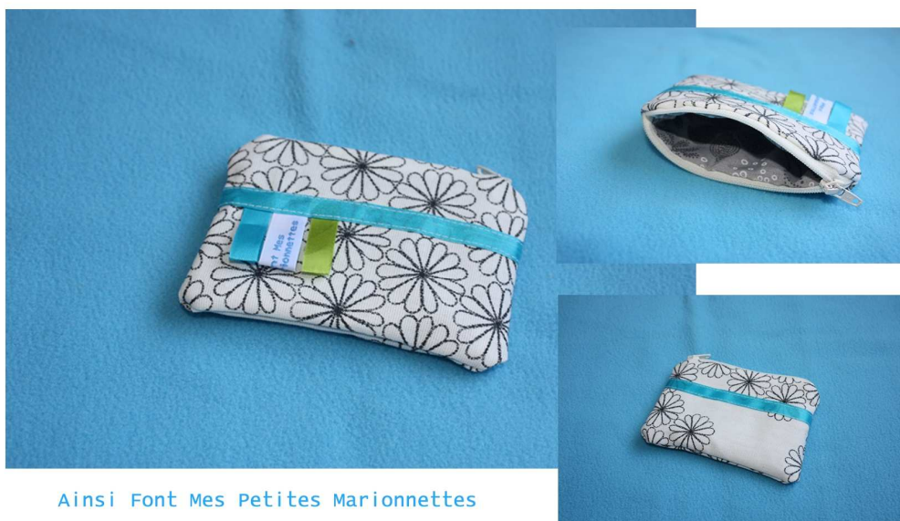
Ainsi Font Mes Petites Marionnettes