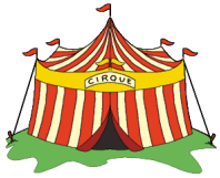
son chapiteau .....