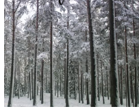
la forêt .....