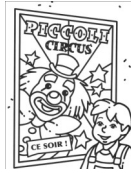
une affiche .....