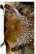
LES PETITES CORNES