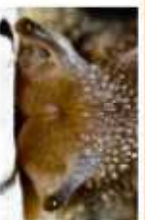
LES PETITES CORNES