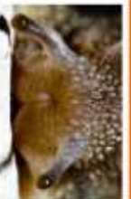
LES PETITES CORNES