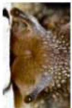
LES PETITES CORNES