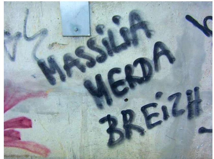
Parc des sports : 050904_1676.jpg

Mes connaissances en langue provençale ne sont pas très étendues mais j'ai comme l'impression que ce monsieur Massilia n'a pas l'air d'aimer beaucoup ce monsieur Breizh. Je me trompe ?