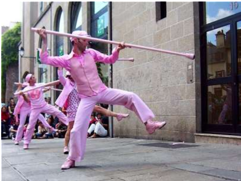
Rallier du Baty 050707_6656.jpg