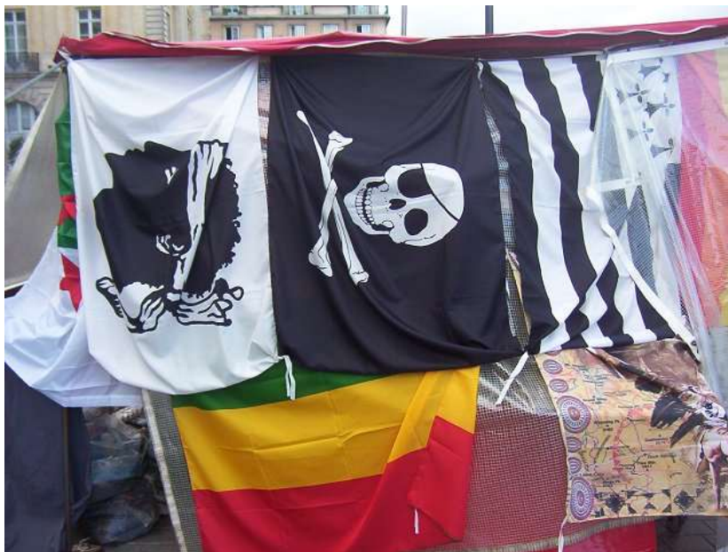
Jardins de la République 050910 1839

On pouvait voir ce samedi, Ici, Un très beau Troupeau De drapeaux, Une très belle Association de rebelles !