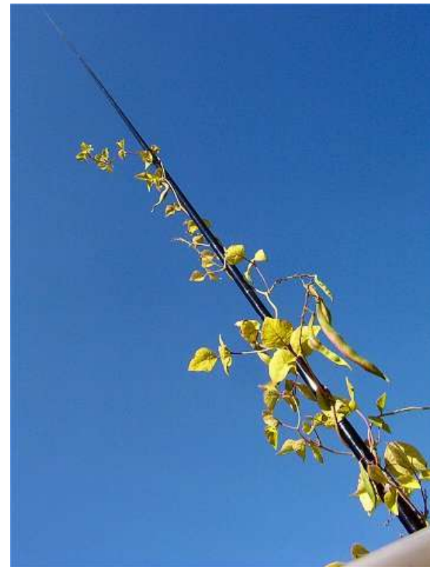
Jardins de la République : 050903_1645.JPG

Quand il sera devenu plus grand que son tuteur le lierre saura-t-il être suffisamment adulte pour ne pas s'accrocher à ce rêve impossible que nous promenons tous : vouloir décrocher la Lune ?