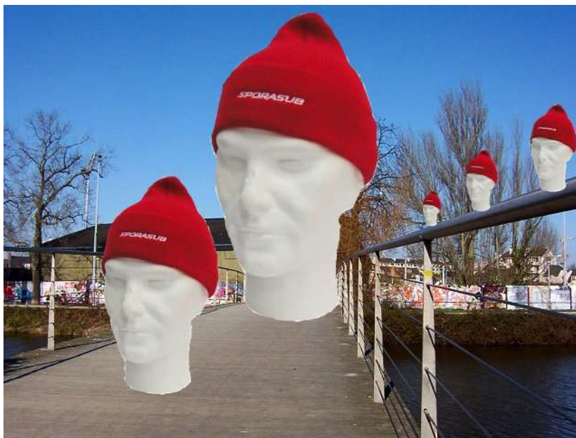
Passrelle des Bonnets rouges : 050319_1727bis.jpg

Cinq apparitions du commandant Cousteau sur une passerelle de Rennes