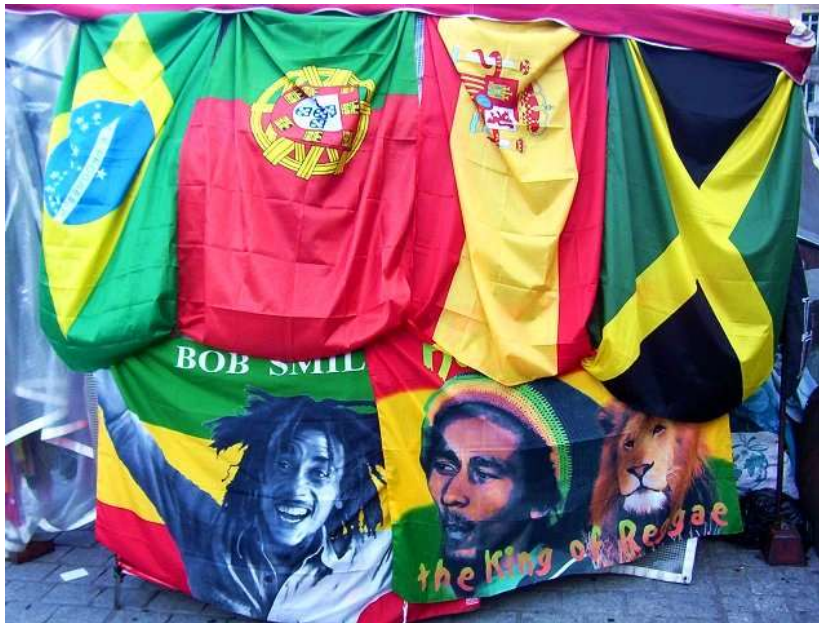
Jardins de la République 050910 1838

Tous ces drapeaux de pays étrangers vont certainement mettre plus d'un xénophobe en pétard !