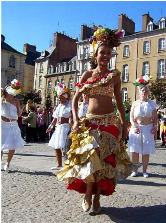
Place de la Mairie 050409_2904.jpg

On peut aller nus pieds Dès le mois de janvier ; Ca devient un brasier Quand arrive février ; On est sous le cagnard Pendant le mois de mars Et quand arrive avril C'est carrément le Brésil !