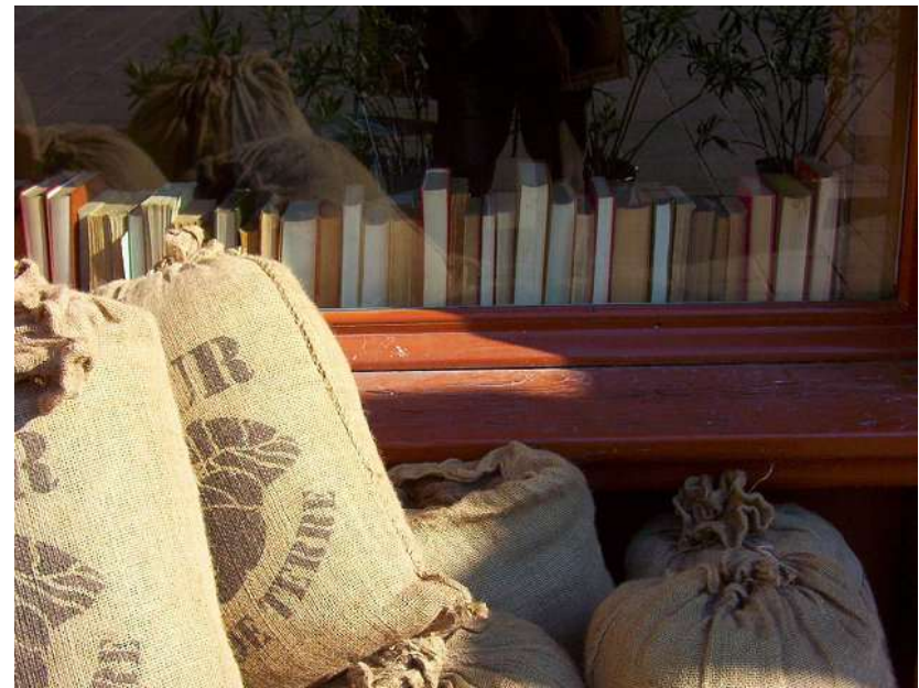
Place Rallier du Baty : 050306_1407.jpg