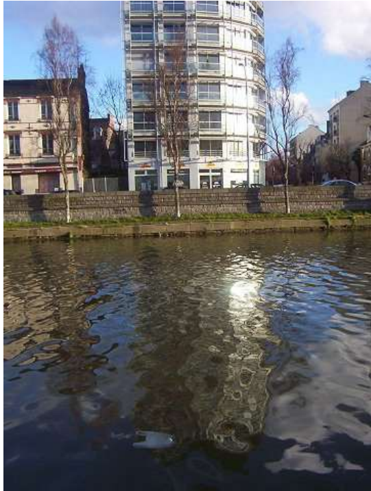
Quai St-Cyr 040313_6961

Il suffit de pas grand chose : ici le miroir déformant le plus naturel qui soit, la Vilaine !