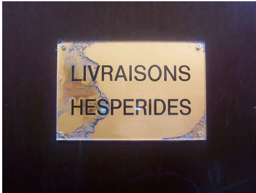
Jardins de la République 040201_6035.jpg

– Vous voulez bien me signer un reçu pour ces cinquante kilos de pommes d’or ?