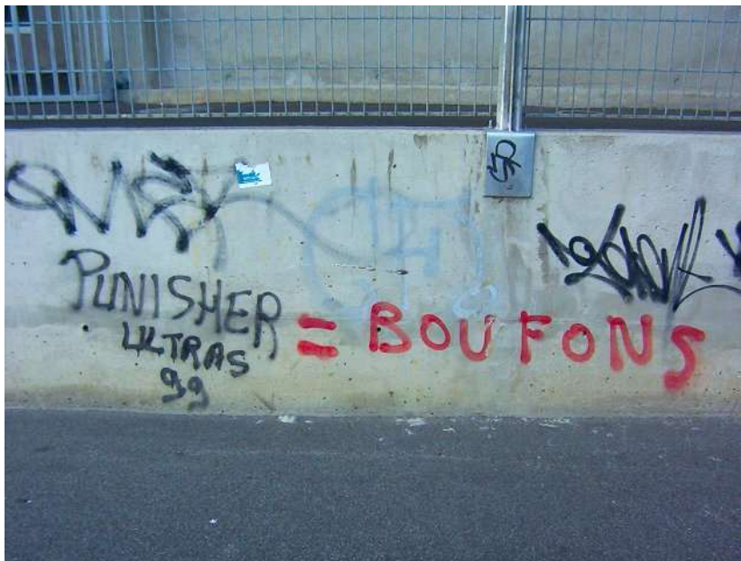
Parc des sports : 050904_1675.jpg

Cette injure est nulle et non avenue : il y manque un « f » !