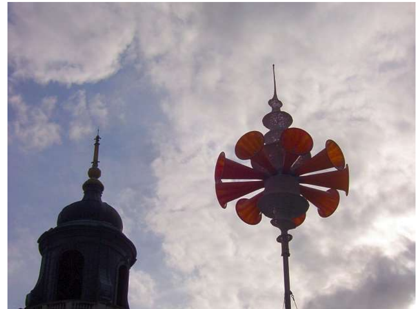
Mairie : 050706_6598.jpg

– Petit clocher deviendra grand pourvu que Dieu lui prête vie ! – Qui t'a rendu si vain, toi qu'on a jamais vu les armes à la main ?