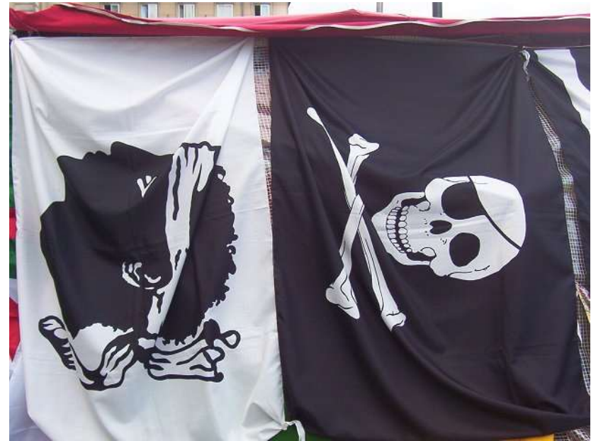
Jardins de la République 050910 1840