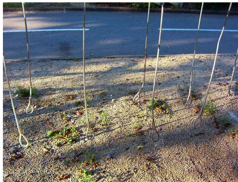
Parc des sports : 050904_1670.jpg

Si le résultat du match de foot vous a réellement désespéré, il vous reste la solution de quitter cette vallée de larmes en recourant à la pendaison. On a dressé ici, à votre intention, quelques potences à cet effet.