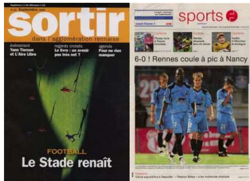
Parc des sports : scepticisme

Un léger scepticisme envahit quelquefois le lecteur de la presse.