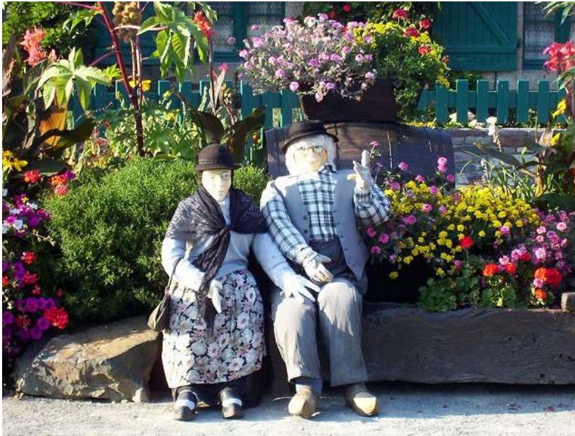
Ecluse de Moulin du comte : 050904_1660.jpg

Les fantômes réjouis et réjouissants de Raymond Souplex et Jane Sourza saluent les joggers, les blogueurs, les blagueurs et les dragueurs pleins de vigueur.