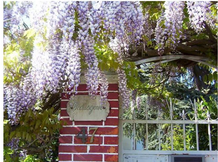
Ecluse St-Martin 050505_4040.jpg

La Maison de la Poésie, Sous sa glycine intemporelle, A quelle nostalgie Nous invite-t-elle Tandis que le joggeur dominical Et le cycliste matinal Passent, indifférents A la fuite du temps ?