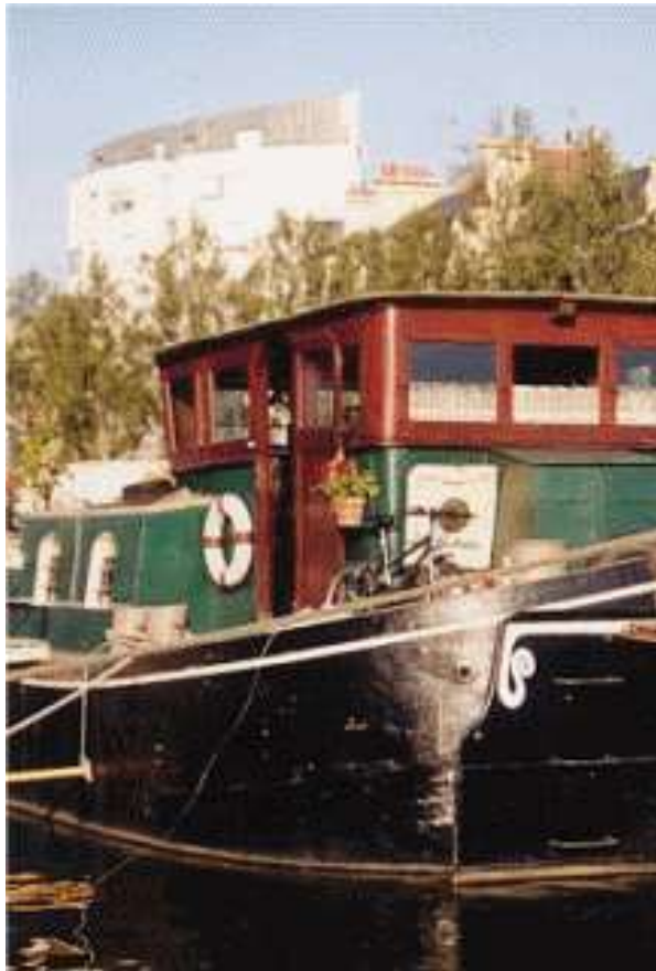
Quai St-Cyr : Péniches

Paroles de Bobby Lapointe ; photographie de Joe Krapov