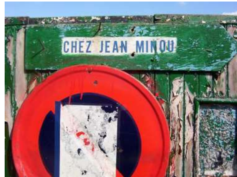
Prairies St-Martin 050505_4060.jpg

Plus la peine de chercher les minettes : Elles se sont donné rendez-vous Pour un petit brin de causette Chez leur grand ami Jean Minou