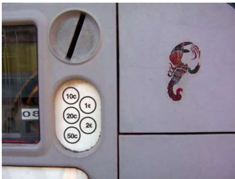
Jardins de la République 050306_1303.jpg

Aujourd'hui, amis natifs du scorpion, n'hésitez pas à vous fendre d'un euro et dix centimes pour être en règle avec la loi : la présence de Mercure dans la Vierge laisse présager une recrudescence des contrôles de titres de transport sur tout le réseau STAR.