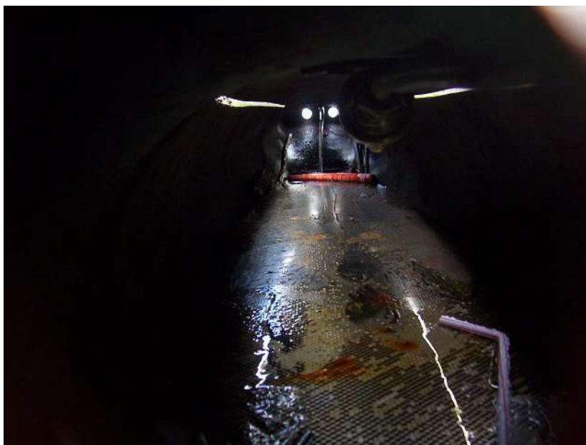
Place Rallier du Baty 040417_8372.jpg