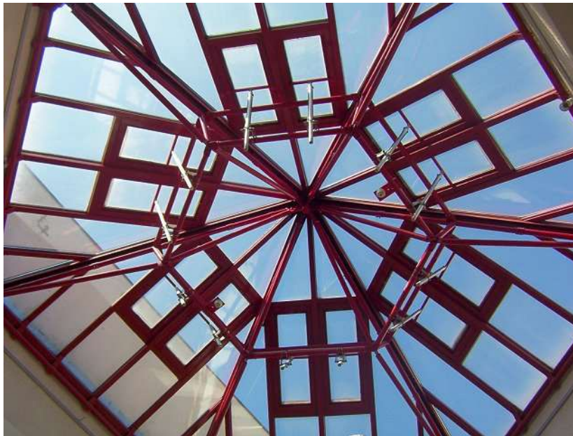
Triangle : 050904_1684.jpg