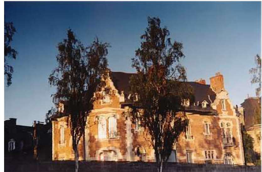
Quai St-Cyr 227H maison orange