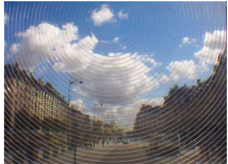
Jardins de la République 050826_1493.JPG