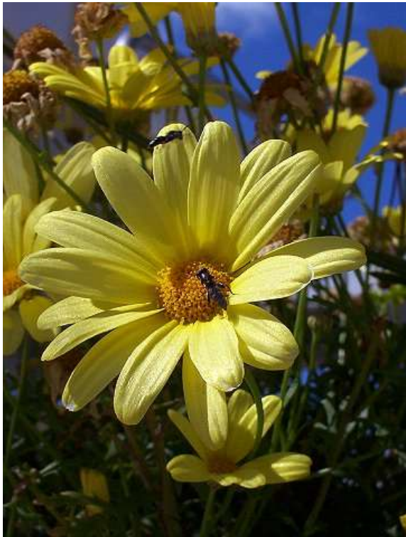
Jardins de la République 050826_1502.jpg