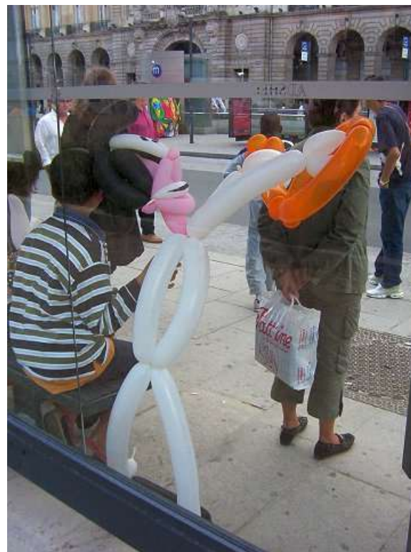
Jardins de la République 050910 1837

Les chauffeurs de la STAR n'ont pas le droit de conduire en bermuda l'été. Par contre les passagers ont le droit de monter dans le bus avec leur poupée gonflable ? Je n'y comprends plus rien !