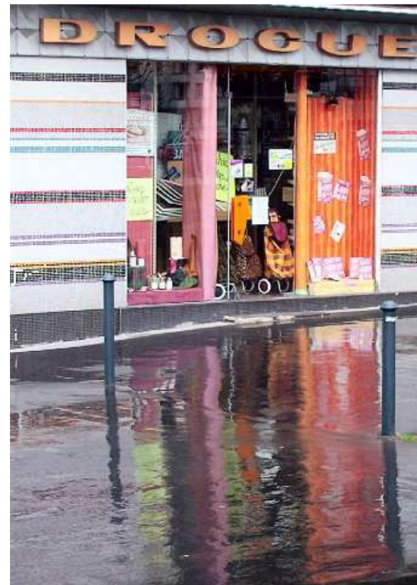
Quai st-Cyr 040321_7364.jpg

Evidemment, si les dealers ont pignon sur rue !