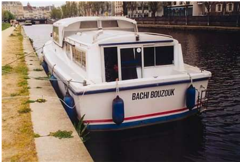
Quai St-Cyr 313 bachi-bouzouk quai st cyr

Bougre d'amiral de bateau-lavoir ! Flibustiers de carnaval ! Marins d'eau douce !