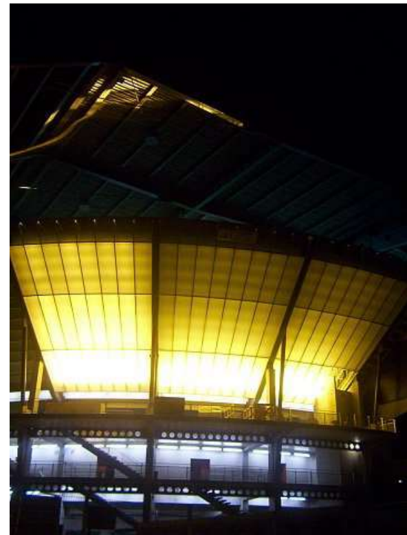
Parc des sports 040216_6424

Texte de Jean Racine ; Photographie de Joe Krapov