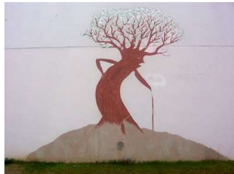
Square Sarah Bernhardt 040201_6067.jpg

Paroles de Maxime Le Forestier