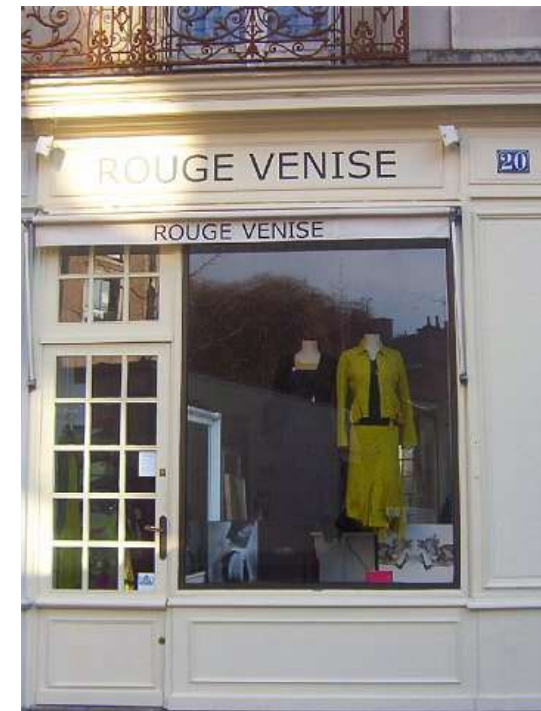
Place Rallier du Baty 040228_6654.jpg

Texte d'Alfred de Musset complété et illustré par Joe Krapov