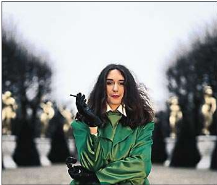
Complexe du Berry 08_George_Sand_mitte.jpg

C'était une femme mais elle s'appelait George ; elle s'habillait en homme et elle fumait le cigare. Car George Sand était toujours prête à s'amuser avec son petit Chopin dans le bureau ovale, mais lui, comme tout stagiaire qui se respecte, ne trouvait pas ça drôle.