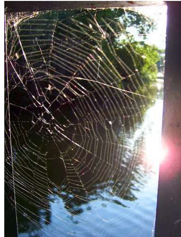
Ecluse de Moulin du comte : 050904_1666.jpg

Une araignée a pris le soleil dans sa toile.