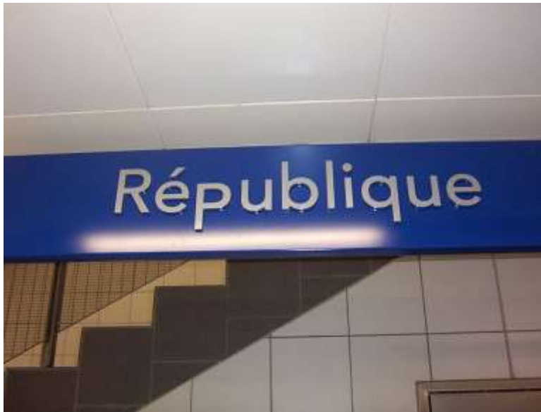
Jardins de la République 040424_8458.jpg

Sous les jardins qu'assomme un air de canicule Le « P » de « République » a un air majuscule Alors que l'on eût pu, s'il n'y en avait plus, À la place du « p » juste tourner un « q ».