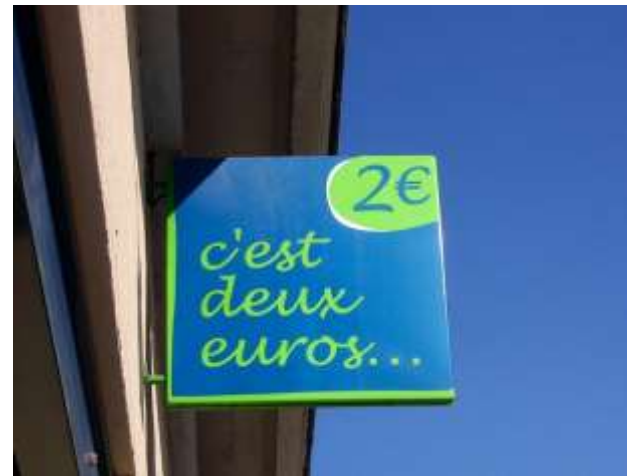
Jardins de la République 050908_1726 et 0905_1646