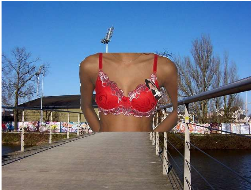
Passerelle des Bonnets rouges : 050319_1727-4.jpg

Vue de mon balcon / par Isaure Chassériau