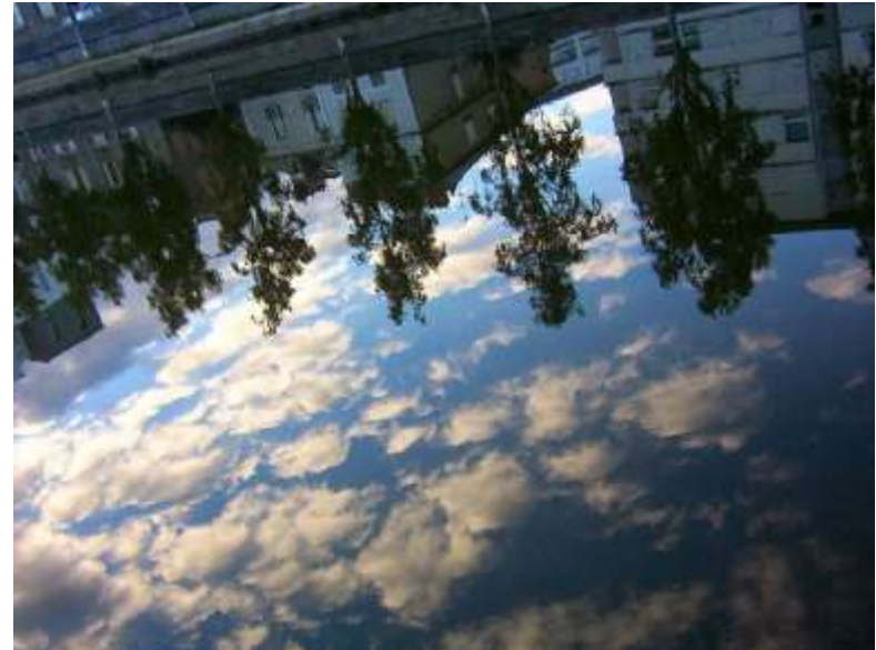
Quai St-Cyr 040901_4030.jpg

Pourquoi donc appeler Vilaine Un aussi joli miroir d'eau Où se mirent, moutons sans laine, Par-dessus les toits de Verlaine, Les nuages d'un ciel si beau ?