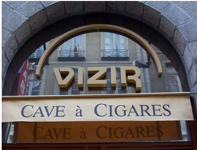
Rue Le Bastard 050910 1834

Le magasin préféré de Bill Clinton : la forme en ovale de l'arcade lui rappelle le bon temps de la vie au bureau !