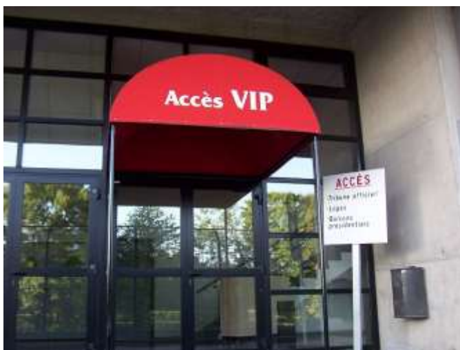
Parc des sports : 050904_1674.jpg