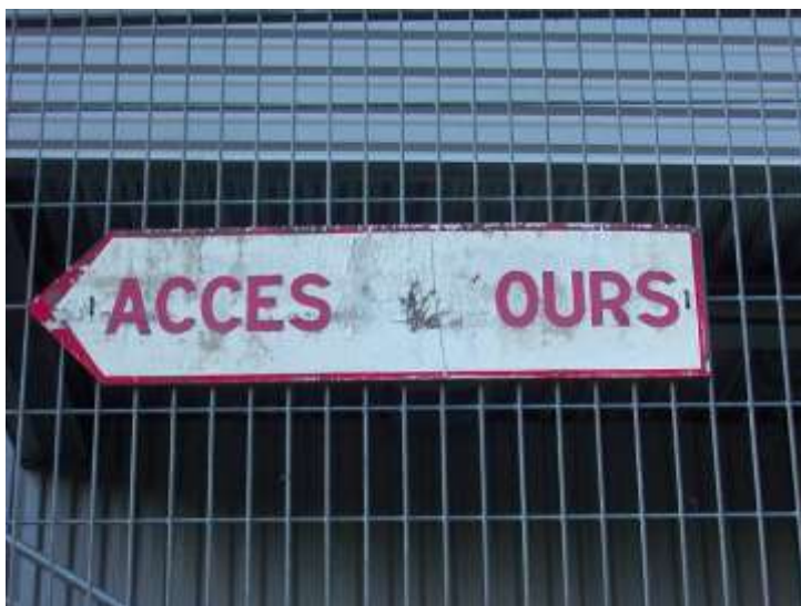
Parc des sports : 050904_1673.jpg