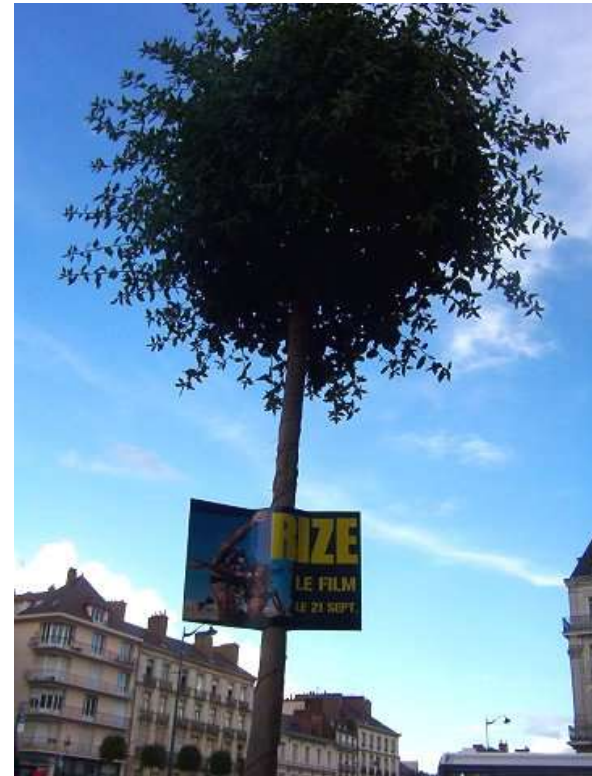
Jardins de la République 050910 1841