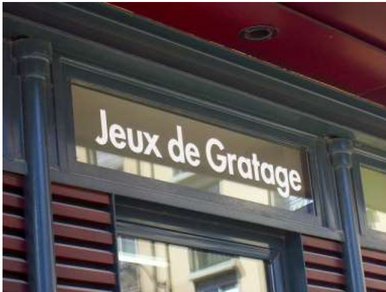
Jardins de la République 050826_1503.jpg