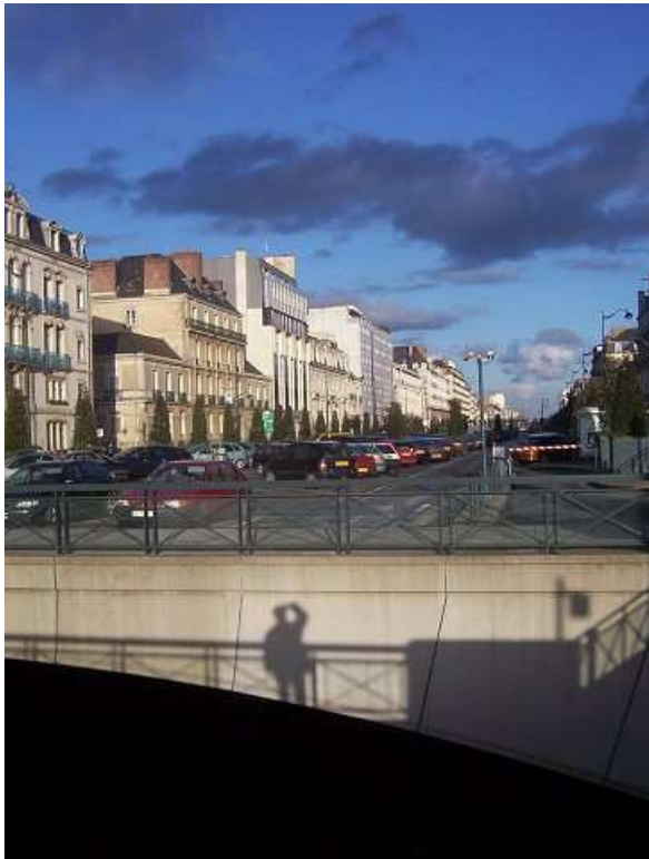
Jardins de la République 040313_6975