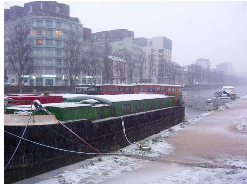
Quai St-Cyr 040227_6565

Aujourd'hui la Dame blanche a bien mérité son nom !