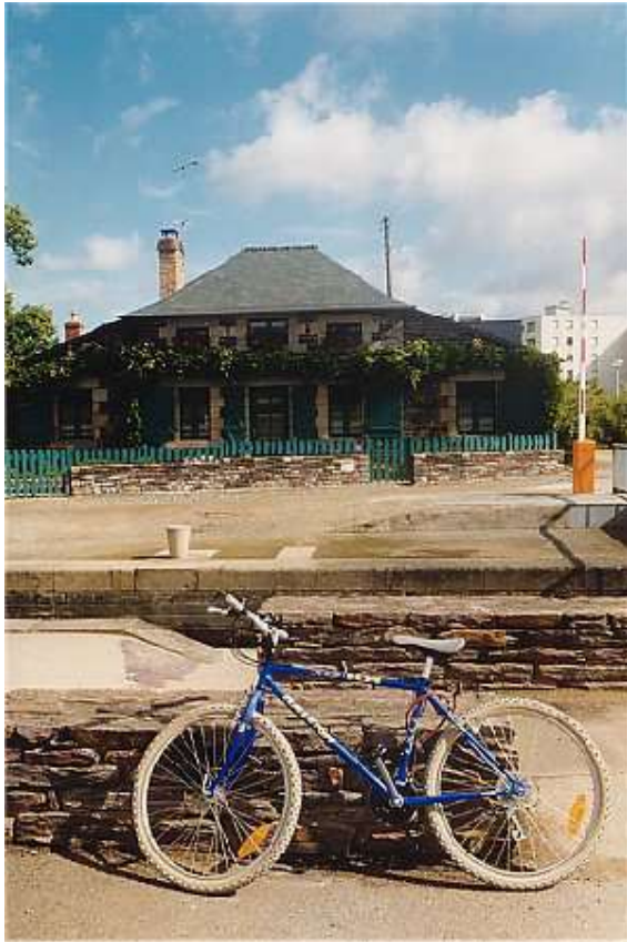
Ecluse de Moulin du comte : 9812 écluse moulin du comte avec vélo bleu.jpg

Cette belle bicyclette bleue m'appartenait jadis Et me fut dérobée, un soir, place des Lices. Si le voleur, ce jour, se sent pris de remords Il peut me contacter Pour me la restituer Car je pédale encore !