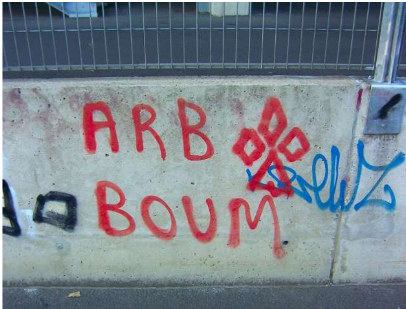
Parc des sports : 050904_1672.jpg

L'Association des Résidents de Beauregard (A.R.B.) organise une surprise-partie. Oui, d'accord mais à quel endroit et à quelle heure ?