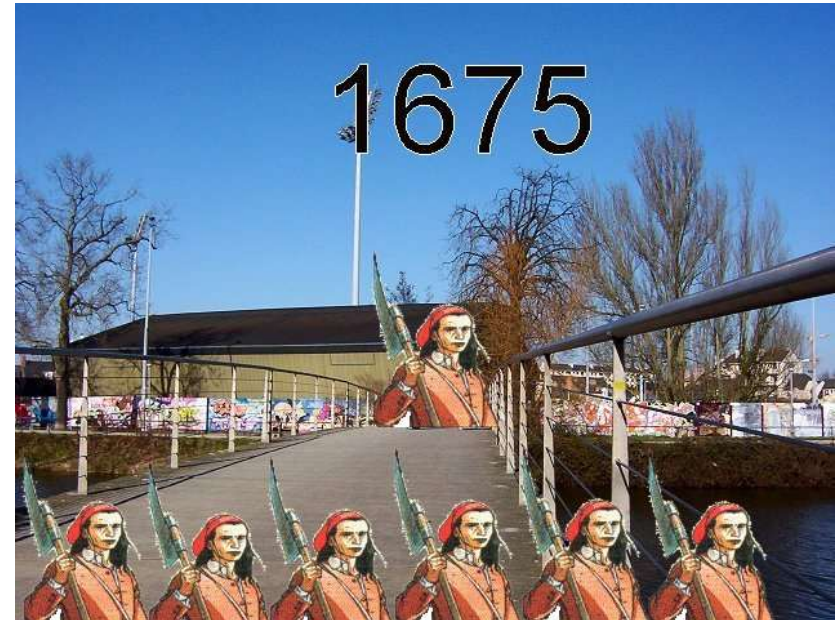
Passerelle des Bonnets rouges 050319_1727-5.jpg