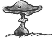
un champ p ignon