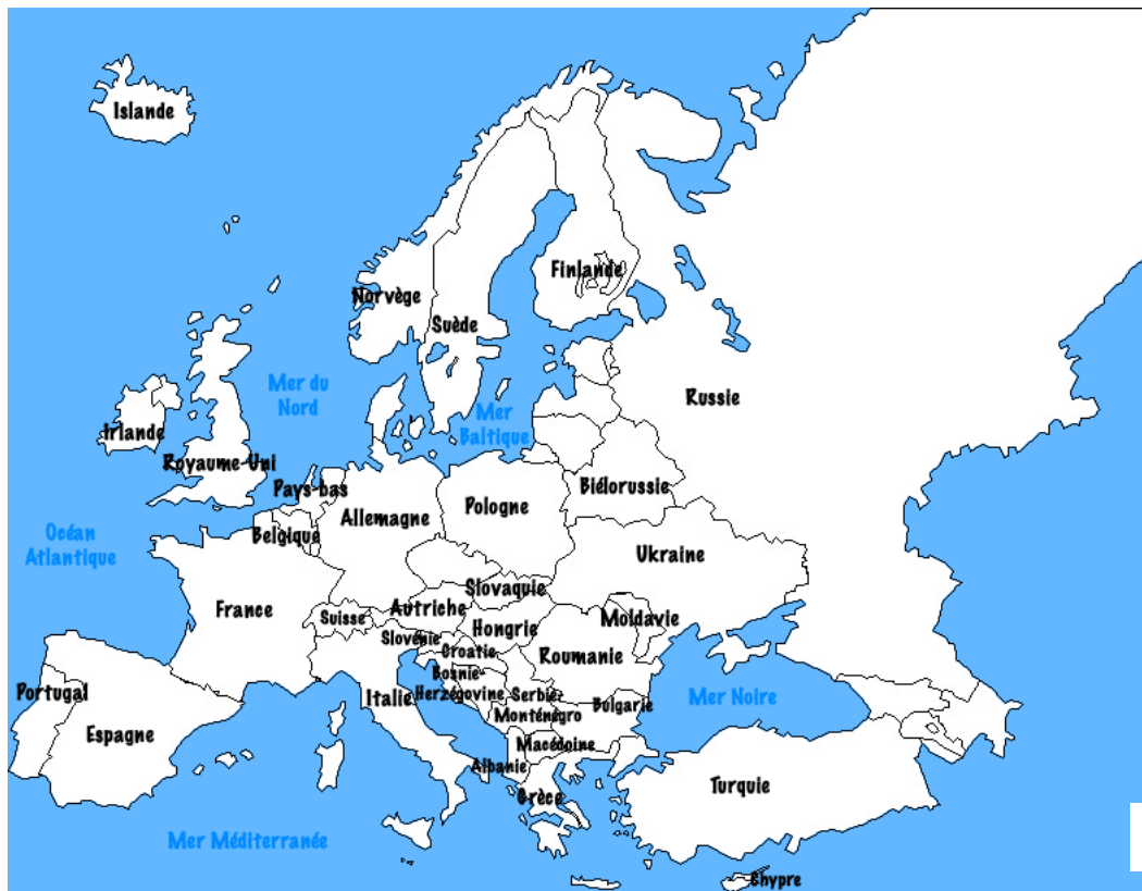
Carte de l'Europe