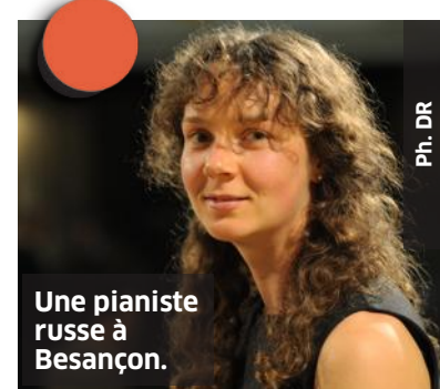
Une pianiste russe à Besançon.