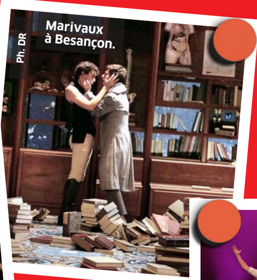
Marivaux à Besançon.