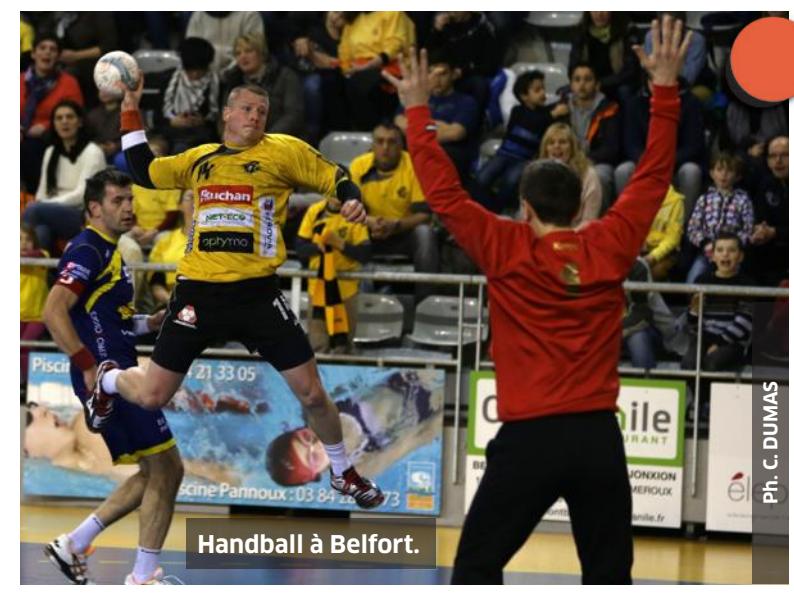
Handball à Belfort.