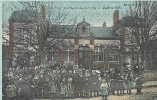
École de filles à la fin du XIX e siècle