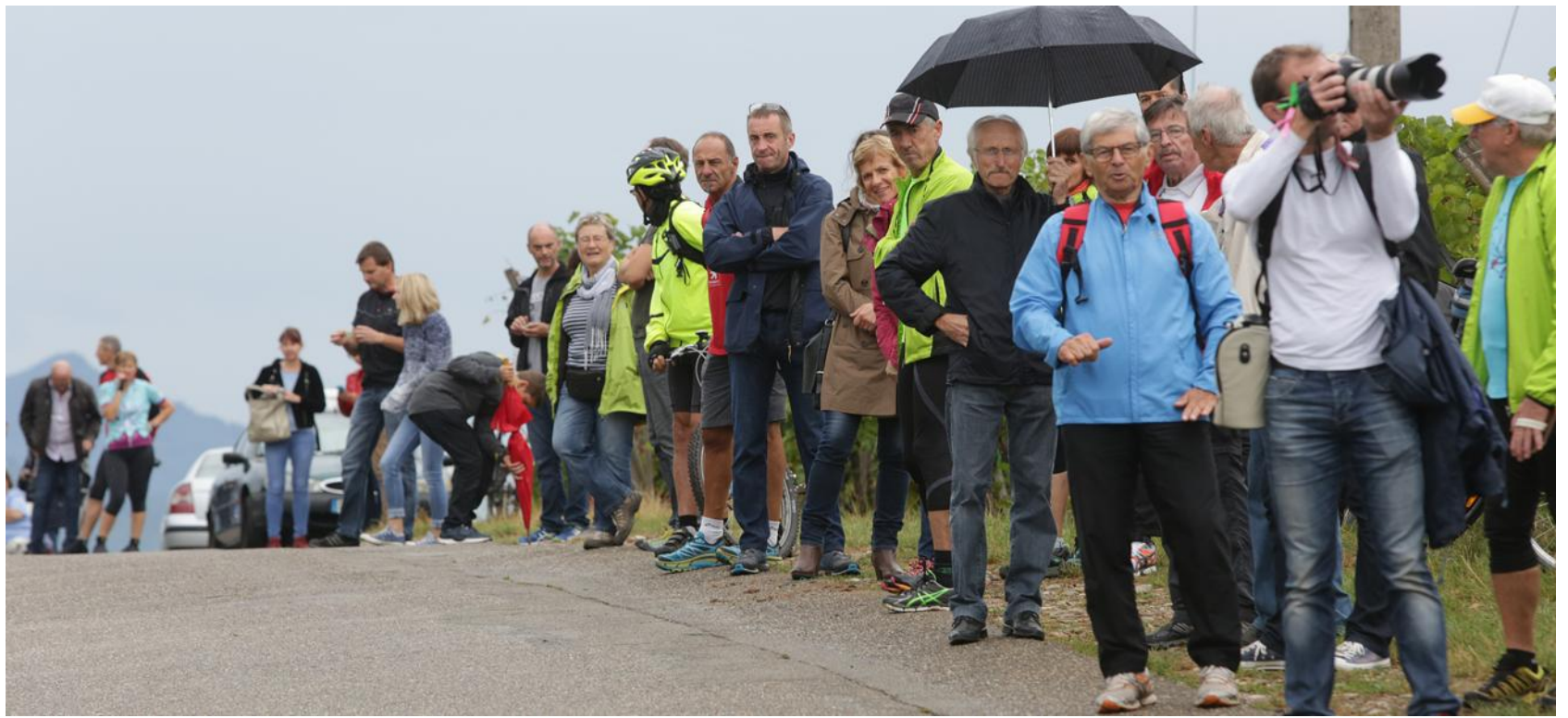
La foule était nombreuse dans la montée vers Katzenthal, comme sur tout le parcours.