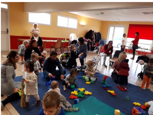
Noël : jeux avant le « spectacle »

En fonction des places disponibles, renseignez-vous !