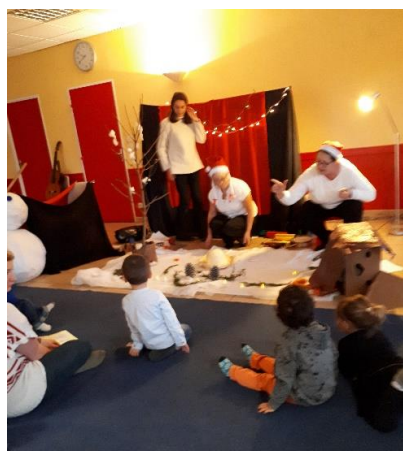
Spectacle d'histoires de neige et d'hiver