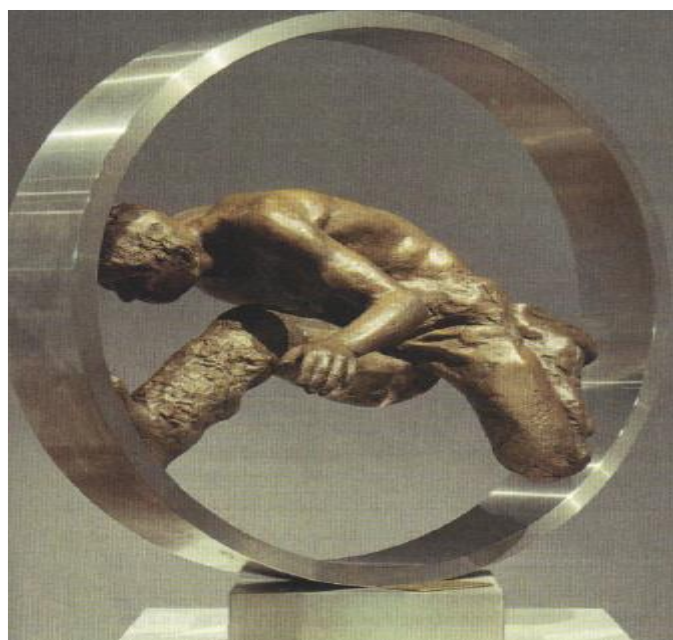
Wolfgang Mattheuer, Sisyphe , 1975. Coll. Privée.