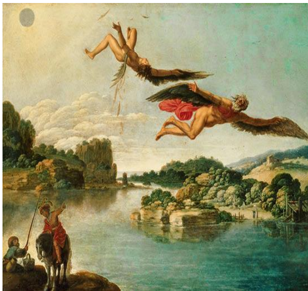
Carlo Saraceni (vers 1579-1620). La Chute d'Icare , 1606-1607, huile sur toile, 34 x 54 cm. Musée national de Capodimonte, Naples.

Dédale réalisa pour le roi de Crète Minos, le labyrinthe dans lequel était enfermé le Minotaure. Le labyrinthe était construit de telle façon que personne ne pouvait s'en échapper ou échapper au Minotaure.