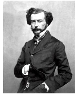
Maxime Du Camp

PS : à propos de reconstruction, Clairin nous livre l'exemple de Maxime Du Camp compilant les témoignages de « communards », ceux qu'il utilisera pour écrire Les convulsions de Paris , récit à charge contre la Commune. Le passage rapporte comment Du Camp obtenait des informations : « Un grand nombre de communards, après la défaite de l'insurrection [...] étaient devenus des espèces de bandits, de vagabonds redoutables qui battaient le pavé de Paris et qui, longtemps, tourmentèrent la population paisible. Tels furent précisément les clients habituels de notre ami. Les premiers convoqués racontèrent la chose aux camarades ; il y avait là quelque argent à gagner sans peine, et ce fut à qui, parmi cette canaille, documenterait l'historien de la Commune. - Prenez garde, lui-dis-je.