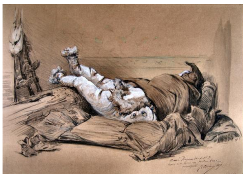
G. Clairin, 1871