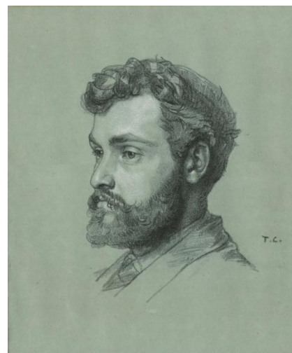
T. Couture, Portrait de Regnault

Clairin assure l'existence d'une union sacrée discutable. Si un réflexe de légitime défense a uni les Parisiens en 1870, la « tranquillité » affirmée n'était pas au rendez-vous. Le récit l'admet quelques lignes plus haut : la méfiance entre les autorités et les populations les plus précaires, entre les bourgeois et les ouvriers en voie d'insurrection pesait. Les opinions dans Paris ne s'étaient pas « fondues ». Quand il s'adresse à sa sœur en 1870, son propos ressemble plus à un pieu mensonge ayant vocation à rassurer la jeune femme que l'expression d'une vérité. Dans le contexte de 1906, en revanche, le propos est en contradiction avec d'autres textes de souvenirs dénonçant pour leur part les traîtres de 1870, le coup de poignard des communards dans le dos de l'armée ou la lâcheté des « capitulars » qui ont refusé de poursuivre la « lutte à outrance ». Qui a raison ? Tout le monde, en fait, selon le point de vue adopté ; et personne dans la logique des convictions et des ambivalences de chacun. Les sentiments