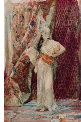
H. Regnault, Intérieur de harem

L'effort pour évaluer le poids de l'imaginaire dans les reconstructions a posteriori peut paraître subtil. La vanité de l'exercice s'estompe toutefois à partir du moment où la question n'est plus de savoir ce qui a été vécu mais ce que le