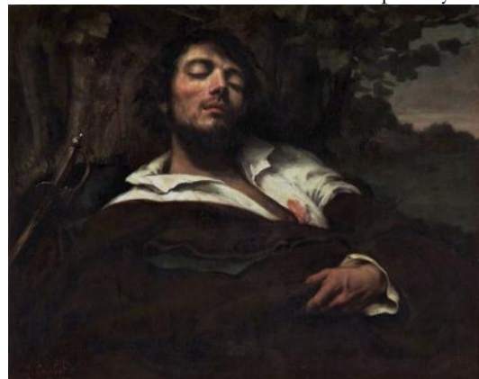
G. Courbet, L'homme blessé (1844-1854)

Les souvenirs d'un peintre est un recueil d'anecdotes qui ne peut pas être mis sur le même plan que les journaux intimes, carnets de guerre et autres compilations de correspondances écrits en direct. Même s'il en partage les défauts, il ne peut pas non plus être apparenté aux récits de souvenirs tardifs ou mémoires, quand ceux-ci