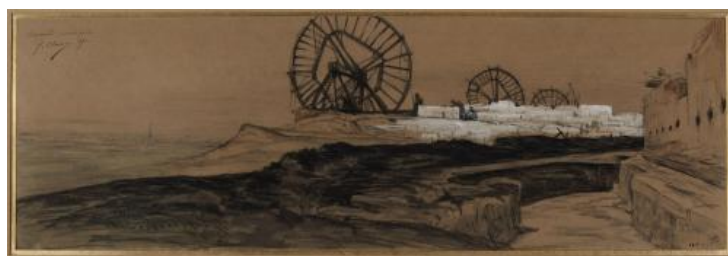
Dessin de G. Clairin, Aux avant-postes à Arcueil, 1871