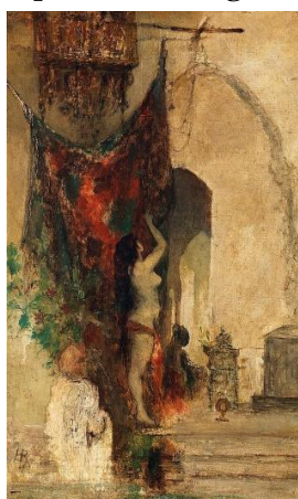
H. Regnault, Au Harem , 1871 Aquarelle, une des dernières