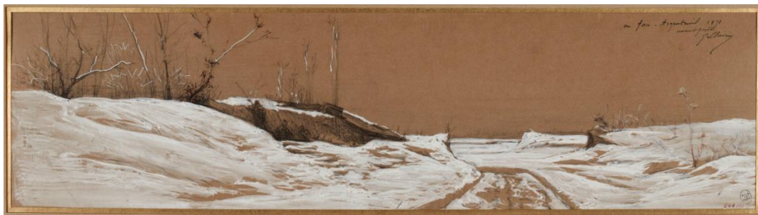
G. Clairin, En face d'Argenteuil, 1871, avant-postes.

distinguer sa perception première de celle plus tardive. Ici se pose la question du maintien du flou : Clairin ignore-t-il le détail parce qu'il lui paraît alors insignifiant ou son jugement est-il celui d'un homme qui soutient, en 1906, la thèse d'une impopularité générale de la Commune ?