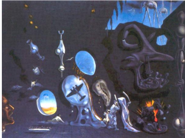
Atomica Melancholia (Dali, 1945, peint en Californie) « Je considère l'amour comme l'unique attitude digne de la vie de l'homme » (Salvador Dali).

Salvador Dali (1904-1989) est associé au mouvement Surréaliste , qui reconnaît l'importance des découvertes de la psychanalyse et de Freud , surtout celle de l'inconscient .