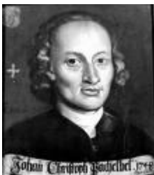
Johann PACHELBEL (Allemagne, 1653-1706)

Canon en ré majeur (1677) pour 3 violons et basse continue