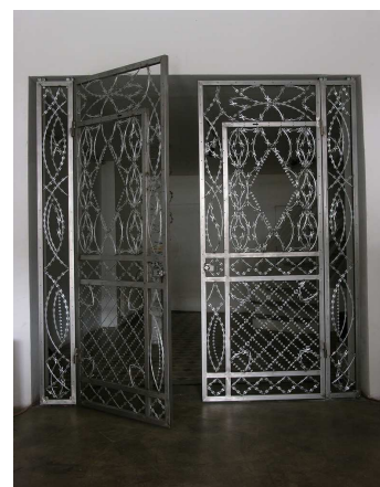
Portail de sécurité , 2009 258 x 263 x 5 cm Sculpture - Acier chromé et barbelé rasoir