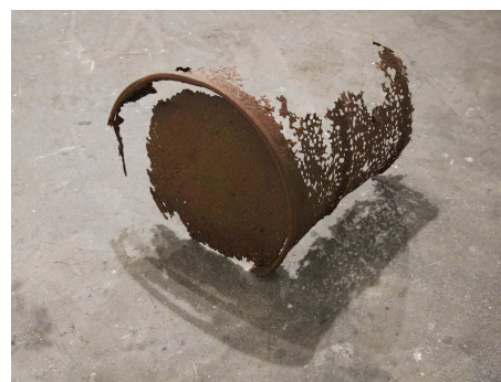
Artefact , 2013 53 x 65 x 72 cm Sculpture - Acier trouvé