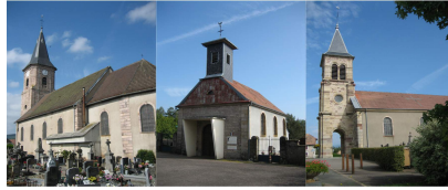
Evette-Salbert - Errevet - Lachapelle sous Chaux - Sermamagny