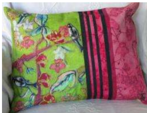
Réf Edition été 35X45 (épuisé)