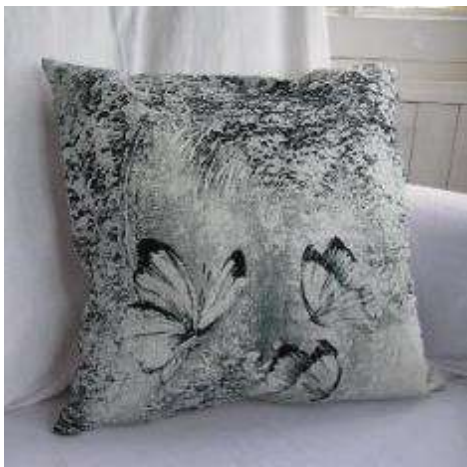
Réf Papillons carré 40X40