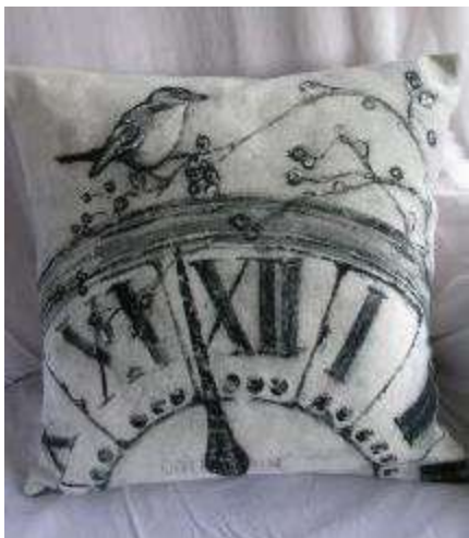
Réf Horloge 40X40 (épuisé)