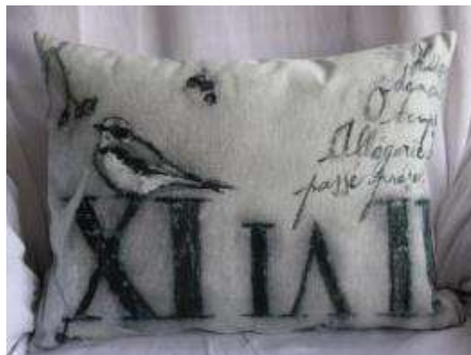
Réf Chiffre et oiseau 35X45 (épuisé)