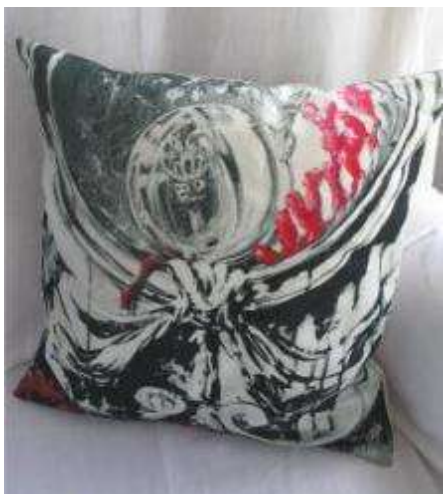
Réf Œil de boeuf 40X40