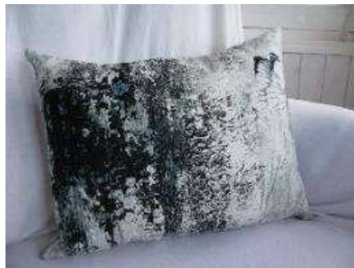
Réf Papillons rectangle 35X45