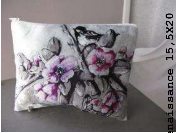
Réf Renaissance 15,5X20 (Velours)