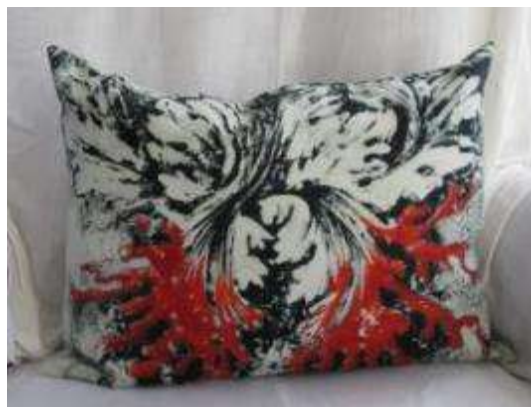
Réf Acanthe 35X45