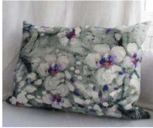
Réf Mauves 35X45