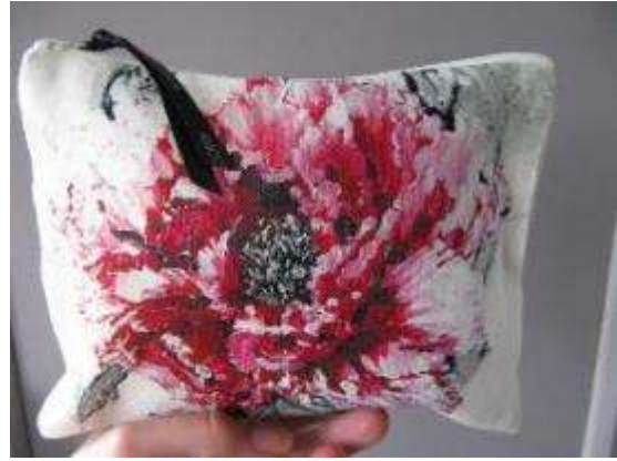
Réf Pivoine rose 15,5X20 (lin/coton)