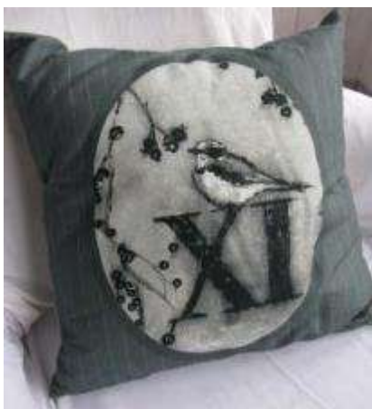
Réf Oiseau ovale 65X65