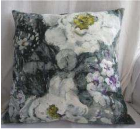
Réf Pivoine 40X40