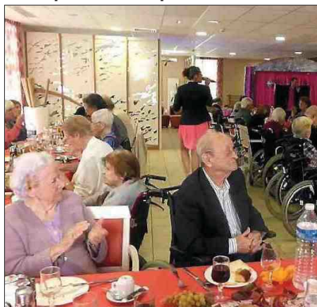
■ Encore un très bon moment pour les résidents de la Villa Impresa.

À l'attention des bénévoles et des résidents les animatrices avaient organisé un repas dansant. Le thème de l'automne était choisi tant pour le menu que pour la décoration. Parmi les bénévoles présents et re-