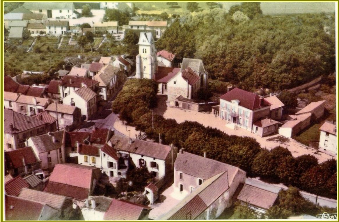
Vue de la place du Général Leclerc (années 1960)

Dans les années 1960, les filles allaient en classe dans une école située dans l'avenue Lucien Brunet et les garçons dans une classe contiguë à la Mairie.