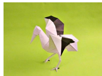
en papier noir-blanc : Canson