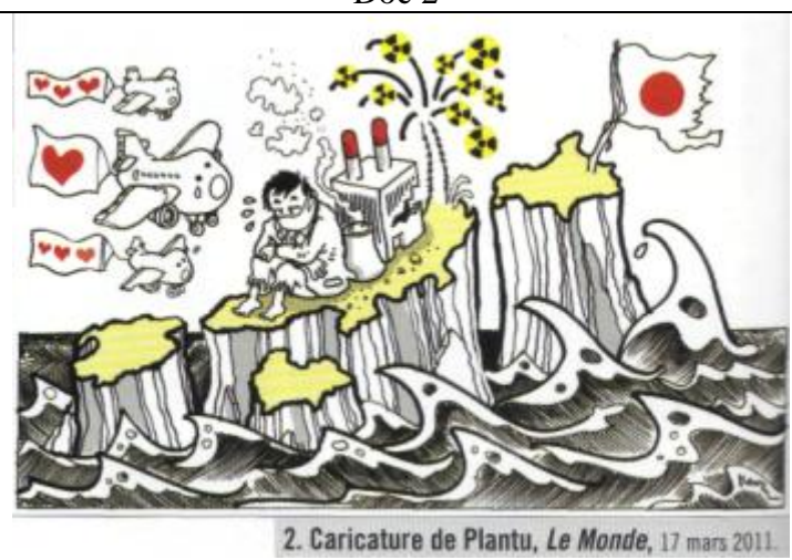
2. Caricature de Plantu, Le Monde, 17 mars 2011.