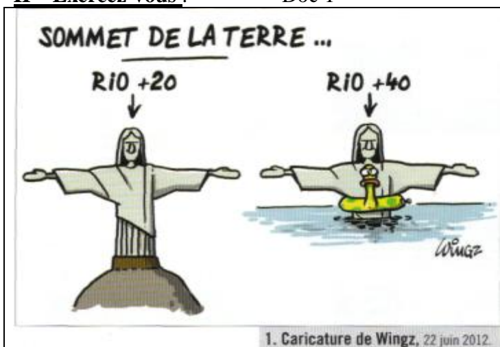
1. Caricature de Wingz, 22 juin 2012.