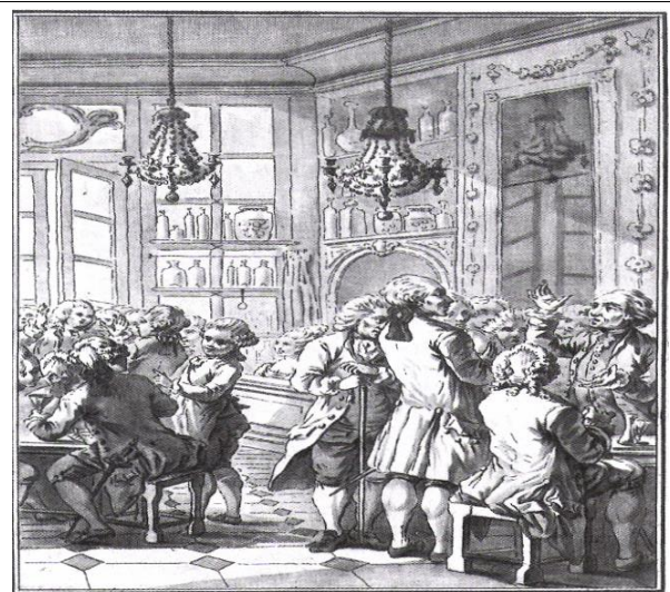
Etablissement de la nouvelle Philosophie 3. Notre Berceau fut un Café.