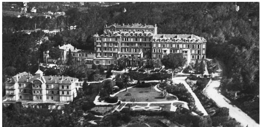
De g à d, 1 er plan : le Grand Hôtel de Costebelle. Arrière plan : l'Ermitage et sur la droite le Grand Hôtel d'Albion sur 5 étages.

La reine Victoria, Impératrice des Indes, est la plus grande souveraine qui règne sur une des nations les plus riches du monde.