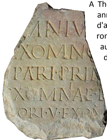
Fragment de stèle découvert à Thorame-Haute (collection privée).

Bourg, à Digne. A Castellane, c'est plusieurs sites qui sont étudiés comme le bourg médiéval de Petra Castellana ou encore le bâti de la chapelle Notre-Dame du Roc, lieu autrefois fortifié. L'archéologie permet des éclairages historiques passionnants. Un projet de mise en valeur est amorcé.