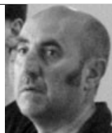
Inscriptions Didier SOULLARD